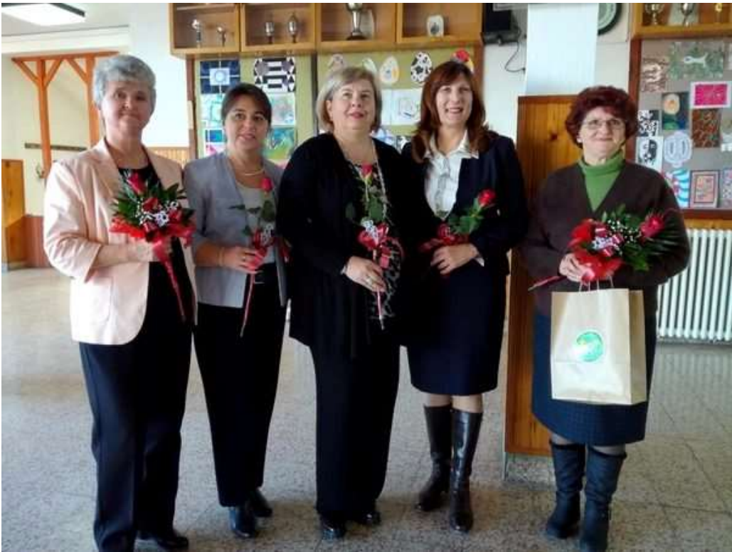
Piše: Tivadar Borbelj